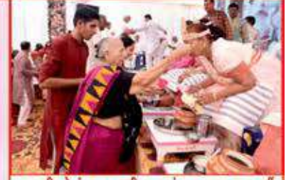
તપસ્વીઓનું ઘસુરસ ચી પારણું કરાવતા લાભાર્થી