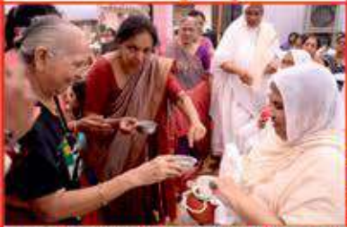
તપસ્વી પૂજ્યશ્રીને ઘસુરસ ચી પારણું