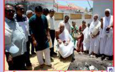
શીલાસ્થાપન પ્રસંગે પૂજ્યશ્રીઓ