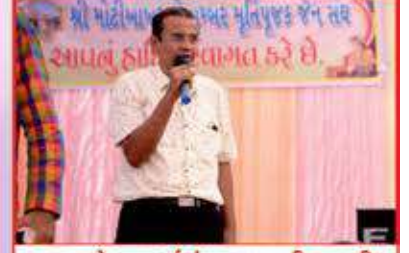
કચ્છ પ્રદેશ પાર્શ્વચંદ્રગચ્છવતી આશીષ