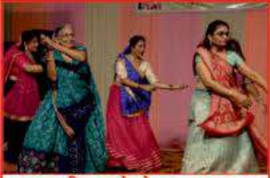
સ્થાનિક બહેનો દ્વારા નૃત્ય