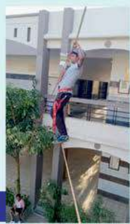
રોપ પર વોક