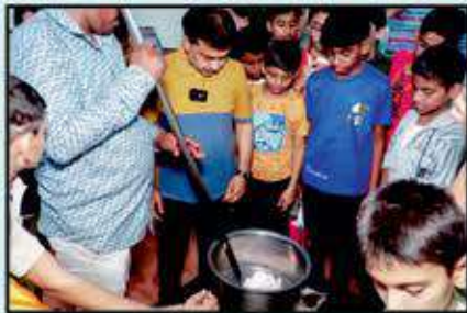
બામ અને વેસલીન બનાવવાની પ્રક્રિયા શીખવવામાં આવી