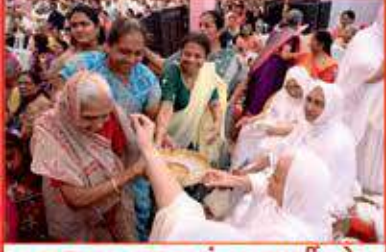
ગુરૂપૂજન કરતાં લાભાર્થીઓ