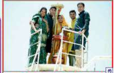
ધ્વજરોહણ કરતા પરિવારજનો