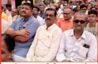
પંચાયત સમીતીના સદસ્યો