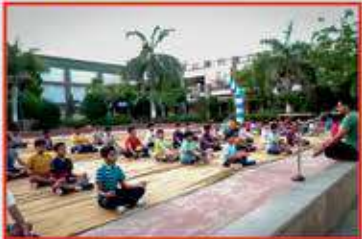
મેડિટેશન અને યોગાની એક્ટિવિટી