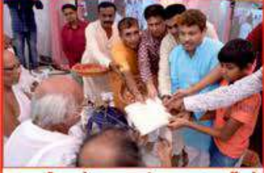
કામળી વહોરાવતા પંચમ લાભાર્થીઓ