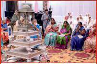
નાણા સમક્ષ પ્રતોચ્ચાર