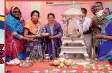
શ્રી આદિનાથ પંચકલ્યાણક પૂજ