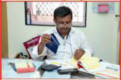
કર્મ હી ધર્મ હૈ