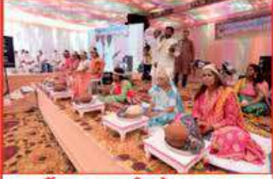
વર્ષોત્તમ તપસ્વીઓના પારણા