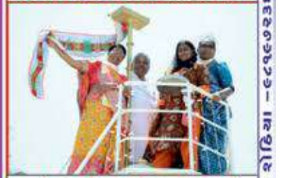
ધ્વજરોહણ બાદની ક્ષણો