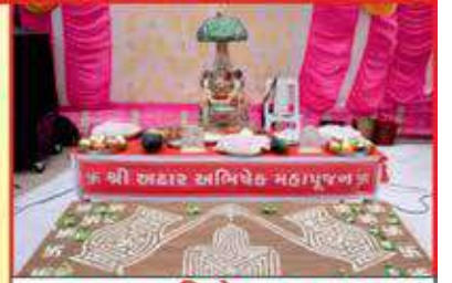
અટાર અભિષેક મહાપૂજન