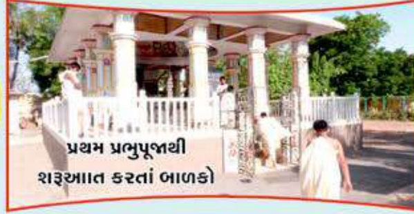
પ્રથમ પ્રભુપૂજથી શરૂઆત કરતાં બાળકો

સમર કેમ્પ (શિબીર) મુખ્યત્વે આપણે ધાર્મિક અથવા એડવેન્ચર એવું કંઈ ધારી લઈએ પણ સોનગઢ રત્નાશ્રમની શિબીર એટલે (All in One) ગુરુકુળ જીવનના અનુભવો અને પરાવલંબન થી સ્વાવલંબન તરફનો પ્રયાણ આવું તો કેટલુચ બધું શીખવા મળ્યું..