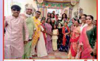
પ્રભુજીના પોજણા કરતા લાભાર્થીઓ