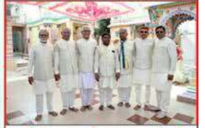
શ્રીસંઘના વર્તમાન સારથીઓ