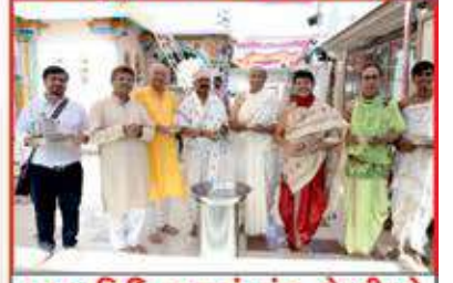
પૂજનવિધિ કરતાં સંઘ શ્રેષ્ઠીઓ