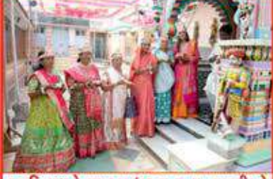
આદિનાથને ઘસુરસ ધરવા જતા તપસ્વીઓ