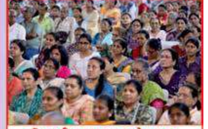
ઉપસ્થિત માનવ મહેરામણ