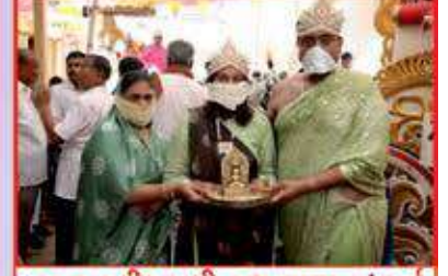
નગર પરીક્રમાથી પ્રભુ પાછા પધાર્યા