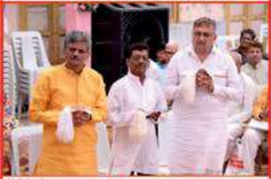
(*305) પ્રત લેતા શ્રાવકો