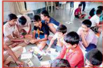
આર્ટ ને ક્રાફ્ટ એક્ટિવિટી