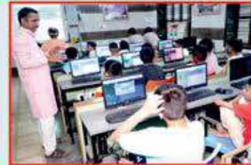
કોમ્પ્યુટર સોફ્ટવેરનું જ્ઞાન આપતા શિક્ષક