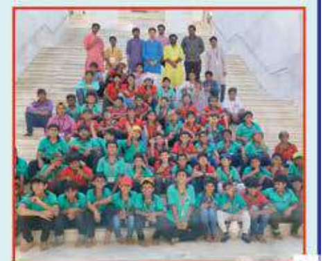
બાળકોને સમર કેમ્પ દરમિયાન પાલીતાણાની યાત્રા કરવામાં આવી