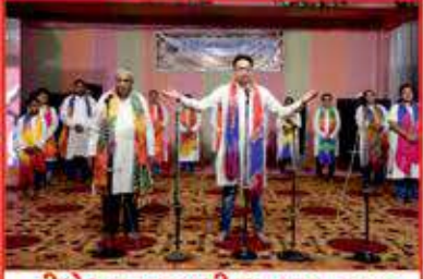
ડીબેટ્સ ખાખરીયા ગૃપ દ્વારા