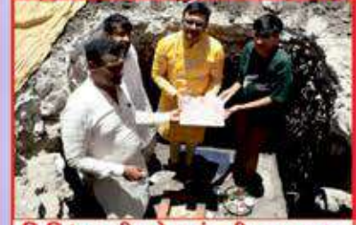
વિવિધલક્ષી હોલનું શીલાસ્થાપન