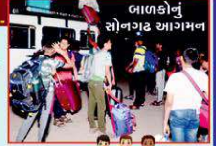
બાળકોનું સોનગઢ આગમન