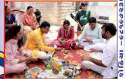
ભૂદેવો દ્વારા પૂજ અર્ચના